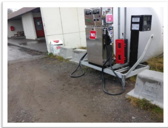
Ófullnægjandi frágangur á olíuafgreiðslu

Á árinu 2013 komu upp nokkur mál vegna lyktarmengunar, en jákvætt var hvað minna bar á kvörtun vegna vondrar lyktar frá fiskþurrkunum en var fyrir tveimur árum síðan. Reyking á kjöti á Blönduósi olli miklum ama á þeim tíma sem framleiðsla var mikil. Lyktarmál eru efið viðureignar fyrir Heilbrigðiseftirlitið þar sem ekki er einfalt að setja mælikvarða á það hvað er vond lykt og hvað góð sömuleiðis ekki heldur hvað er mikil og hvað er lítil lykt. Stundum getur verið erfitt að rekja uppsprettu óþolandi lyktar t.d. ef bensín eða olíulykt berst upp úr niðurföllum á milli húsa.