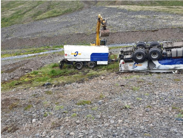
Olíuflutningabíll á Öxnadalsheiðinni í júlí 2019 .

olíuflutningabíll var nýbúinn að fylla á tankinn. Í kjölfar fækkunar olíubirgðastöðva á eftirlitssvæðinu hafa flutningar á olíu stóraukist á vegum sem væntanlega hefur aukið áhættu á óhöppum. Í framhaldi af slysinu á Öxnadalsheiði hefur eftirlitið lagt áherslu á að umhverfisyfirvöld vinni að áhættumati og bættri viðbragðsáætlun vegna aukinna olíuflutninga á vegunum. Lykillinn að því er að hafa yfirlit um hversu mikið magn af olíu er flutt yfir helstu fjallvegi og um jarðgöng. Óhöpp við flutninga á landi geta m.a. valdið mengun í vatnsbólum og laxveiðiám og spjöllum á náttúru Íslands.