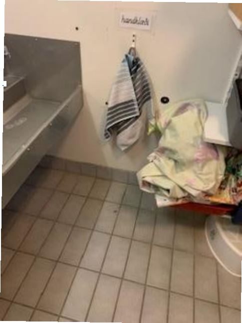
Hér má sjá handlaug á leikskóla þar sem er aðeins eitt handklæði fyrir börnin.

hefur orsökina ekki síður verið léleg útloftun þar sem mikil vatnsgufa er í húsnæði, s.s. á baðherbergjum og þar sem gluggar eru ekki opnaðir.