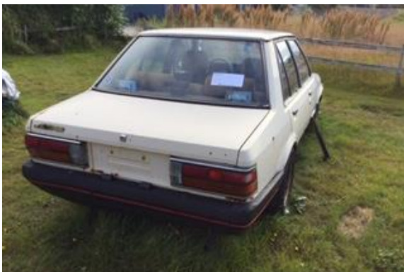
„Verðmæti“ á lóð við íbúðarhús,

Mikilvægt er að koma þeim skilaboðum betur út í íslenskt samfélag að hreinsanir á lóðum, númerslausum bílum og járnarusli er í þágu samfélagsins, þ.e. að halda umhverfi, grunnvatni, lækjum og vötnum auk byggðarlögum ómengduðum og sæmilega snyrtilegum. Þeirra sjónmarmiða gætir of oft að verið sé að ganga á einhvern heilagan rétt manna til að safna verðmætum inn á íbúðarlóðir.