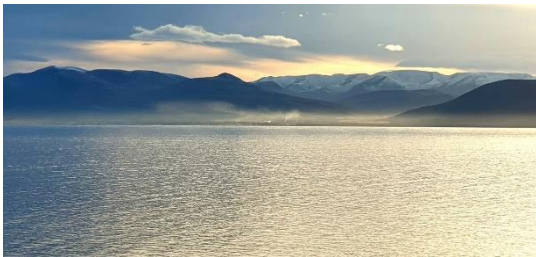
Ljósmynd tekin á Hofsósi sem sýnir loftmengun frá Steinullarverksmiðjunni á Sauðárkróki í október 2019.

Ef illa tekst til við verkun berst frá fiskþurrkun súr og illur daunn af rotnandi fiski. Einkum er um að ræða óþef vegna brennisteinsefnasambanda, frá vexti örvera sem brjóta niður fiskholdið.