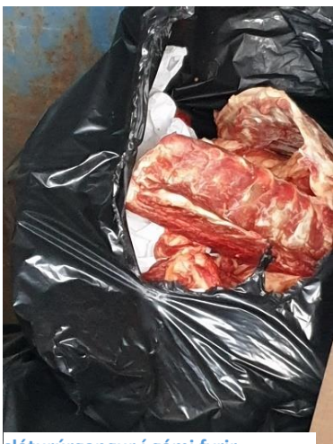
sláturúrgangur í gámi fyrir heimilisúrgang.

Heilbrigðiseftirlitinu barst ábending frá Matvælastofnun um að verið væri að selja heimaslátrað kjöt á netinu og var brugðist við með því að senda viðkomandi tilmæli um að fara að lögum. Heimaslátrun er lögleg til eigin neyslu en sala er óheimil. Umfangsmikil heimaslátrun er áhyggjuefni og ekki einungis út frá öryggi matvæla heldur ekki síður út frá meðferð úrgangs. Sett var af stað ákveðin vinna í að áætla magn og meðferð úrgangs sem fellur til við heimaslátrun, en það er ljóst að úrgangur í gámum gefur til kynna að talsvert sé um sölu og heimavinnslu á kjöti.