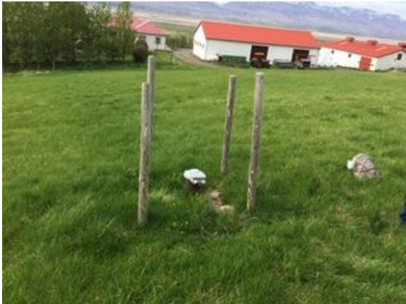
Borhola sem skoðuð var í vinnu við samræmt áhættumat.

Heilbrigðiseftirlitið er byrjað að nýta sér afrakstur þessarar vinnu við utanumhald á gögnum um vatnsveitur á Norðurlandi vestra, en skapalón fyrir áhættumatið er komið inn í Filemaker-grunninn sem HNV notar við eftirlit og gangasöfnum.