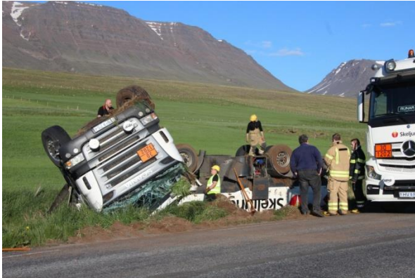
Betur fór en á horfðist þegar olíuflutningabíll valt sumarið 2016.

Aukin krafa er að verða meira áberandi um bættu umhirðu og meðhöndlun úrgangs. Regluverkið hefur ekki fylgt þeim sjónarmiðum eftir, en Heilbrigðiseftirlitið hefur takmarkaða aðkomu að málum á einkalóðum nema ef bein mengunar- eða þá slyshætta stafar af járnaruslinu. Það er fullt tilefni til að endurskoða reglurnar, m.a. með það fyrir augum að skoða hvernig hægt sé að koma að hreinsun á bílflökum og járnarusli á lóðum og lendum, sem blasa við vegfarendum.