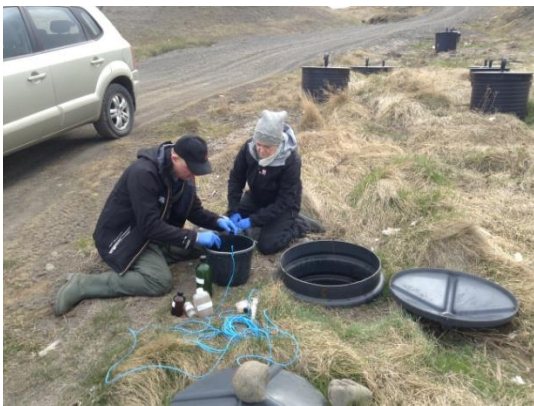
Sýnatoka vegna vöktunarverkefnis við urðunarstað.

Árlega eru tekin sýni af grunnvatni frá urðunarstöðum á Norðurlandi vestra í samræmi við kröfur sem koma fram í starfsleyfisskilyrðum þeirra. Í framhaldi er gerð samantekt á niðurstöðum mengunarmælinganna.